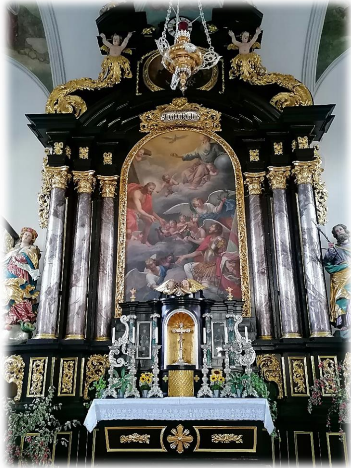
Hochaltar in St. Georg Pressath

Der Bus fährt bei der Rückfahrt dieselben Haltestellen an. Die Kosten pro Person betragen 30 €, sie sind bereits bei der Anmeldung im Pfarrbüro St. Georg zu entrichten.